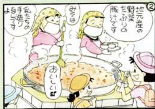
耕ぞう、大地と地域のみらい。