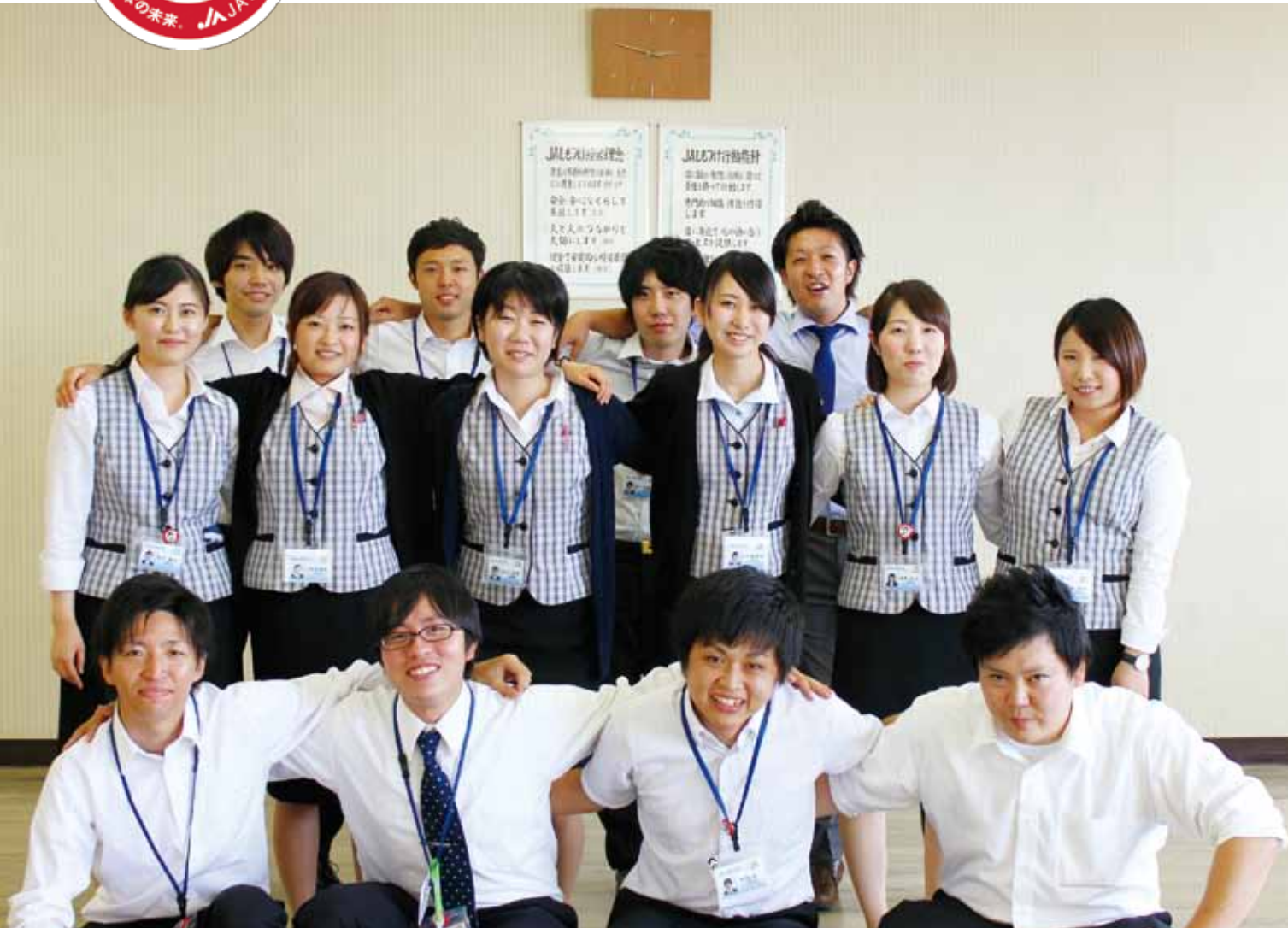
私たち本採用になりました 平成28年度新入職員