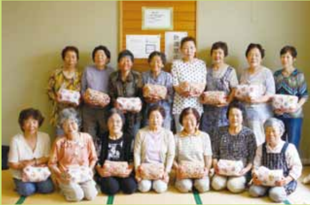
手芸で作ったそば殻入り枕を手に記念写真

このコーナーでは、地域で活躍する皆さんの紹介や大好評「クイズコーナー」、広報誌の編集担当者がチラッと語らせてもらう編集後記をお送りいたします。