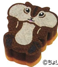
ちょリス マグネットクリップ