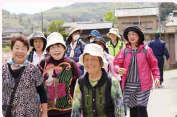
みんな一緒ならいくらでも歩けそうですね！

JAしもつけ女性会は19日、栃木市で毎年恒例のハイキングを行いました。会員126人が参加。同市皆川地区を散策し、新緑の中、心地よい汗を流しました。