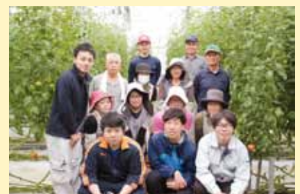
研修お疲れさまでした！