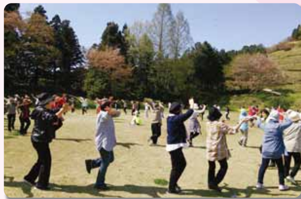
昼食後はみんなで「栃木やぐら音頭」♪

同市の皆川公民館で準備体操をした後に出発。ハイキングは約3 キ の道のりで、途中、傑岑寺と金剛寺を見学しました。両寺では、ご住職に説明いただき、古くから語り継がれる伝説に興味深く耳を傾けていました。昼食後、レクリエーションとして参加者全員で栃木やぐら音頭等を踊り、楽しい時間を過ごしました。