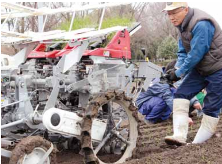
タマネギの定植を行う生産者

同地域で昨年2月に行った自治会アンケートでは、「農業者数が5年以内に現在の3割以下に減少する見込み」という結果が出ました。これを受けて集落営農組織設立を決意し、協議を重ねてきました。最終的に、集落全体の農業活性化・生産性向上・環境保全を目指します。