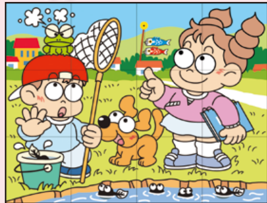
出題●イラスト：酒井栄子