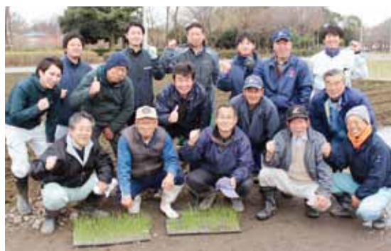
定植を終えた皆さん。収穫は7月上旬予定です！

今後はさらに議論を重ね、具体的な営農計画の作成、耕作放棄地を含む農地の賃借、加入者募集に取り組んでいきます。