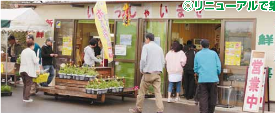
◎リニューアルで集客狙う／いなばの郷

JALしもつけ壬生地区農産物直売所「いなばの郷」が、店舗を改装しました。売り場を拡張することで品数の増加、ひいては生産者の所得向上を目指します。店舗リニューアルを記念して、4月8・9日、「春の大感謝祭」を