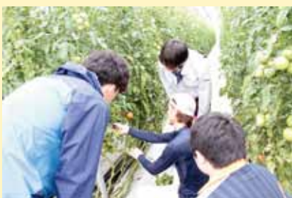
作業の説明を熱心に聴き入ります。