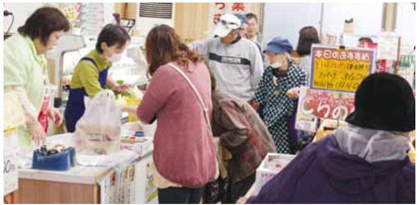
◎インショップ7号店でしもつけフェア開催

開きました。あいにくの雨でしたが、朝から多くの来場者が列をつくり店内には入りきれないほど賑わいました。 イベントでは、3月より運用開始した直売所ポイントカード「ポチカ」のポイント5倍セールや抽選会を行ったほか、農産物百均コーナーを設けました。 皆さんも新しく生まれ変わった同直売所にぜひ足をお運びください。