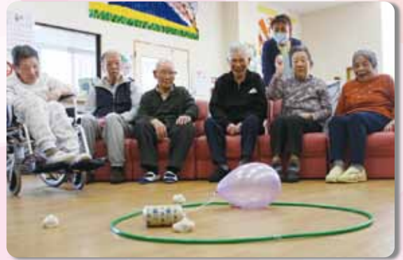
よく狙ってお手玉を当てます

今回は、遠くからお手玉を投げ風船に当てて輪っかから出すミニゲームや、大きな風船を使ったバレーボールラリーに挑戦。お手玉が風船に当たると参加者は笑顔を見せ、拍手して盛り上がりました。また、童謡合唱では「ふるさと」や「春の小川」などを歌いました。