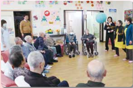
風船を落とさないよう集中してラリーします