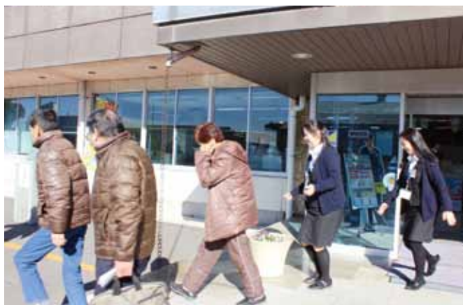
店舗外へ避難する利用者と職員

JAは1月12日、JAグループ栃木大規模災害統一訓練を実施しました。この訓練は「大規模災害への対策方針」による対応を行うため、事業継続計画（BCP）に基づいた統一訓練で、県内10JA、中央会、連合会が参加しました。JAでは、利用者をまじえて壬生支店・センターと、藤岡支店・センターで実施。 訓練では、災害発生時の窓口のお客様や職員の安否確認、被害状況の把握と各種業務の手順などを確認しました。 災害発生時も適切な対応が取れるよう、今後も訓練を続けます。