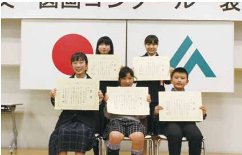
受賞した皆さん、おめでとうございます