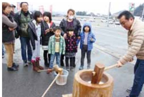
つきたてのお餅をふるまいました