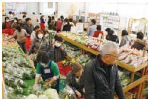
入口からレジまでの長蛇の列です