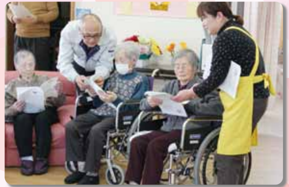
一緒に童謡を合唱