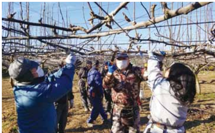
実際に剪定する参加者