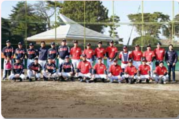
左がJAしもつけ野球部

当JAでは部活動制度があります。現在は野球部・フットサル部・剣道部・テニス部の4つの部活が、部署を問わず職員同士の交流の場として活動しています。今回は野球部とフットサル部が、それぞれ交流試合を行い、親睦を深めました。