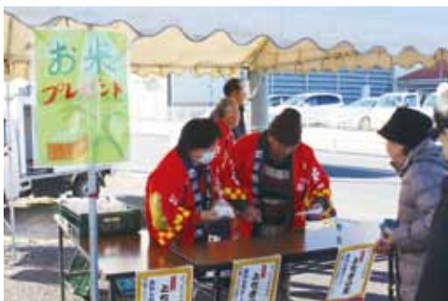
お米「とちぎの星」を無料配布