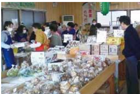
新鮮な農産物を求める買い物客