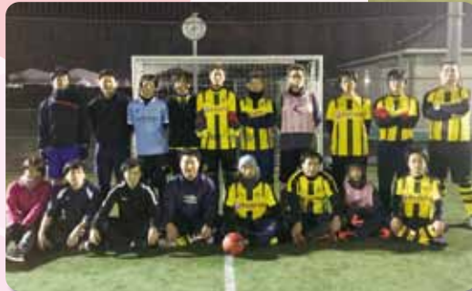
全農とちぎ(左)とJAしもつけ(右)

JA全農とちぎフットサル部、大平町ぶどう組合青年部の3チームで交流試合を開きました。2017年内最後の活動となり、蹴り納めとしました。