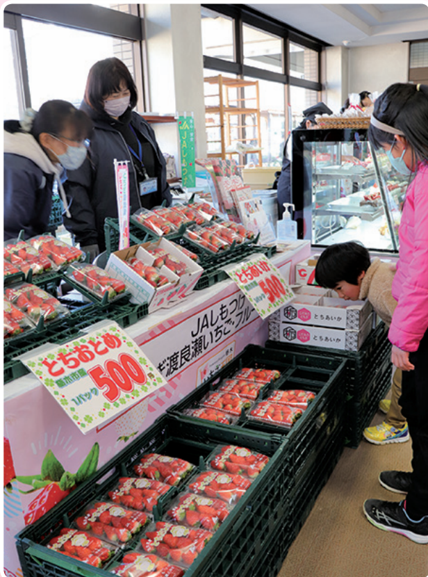
来場者でにぎわうJAブース

JAしもつけは2月11・12日の2日間にわたり、「とちぎ花センター」で開催の「花と莓のフェスティバル～届け！花と莓で贈るありがとうの気持ち 栃木県誕生150年に思いを寄せて～」に出店し、旬を迎えた地元産イチゴを消費者にPRしました。