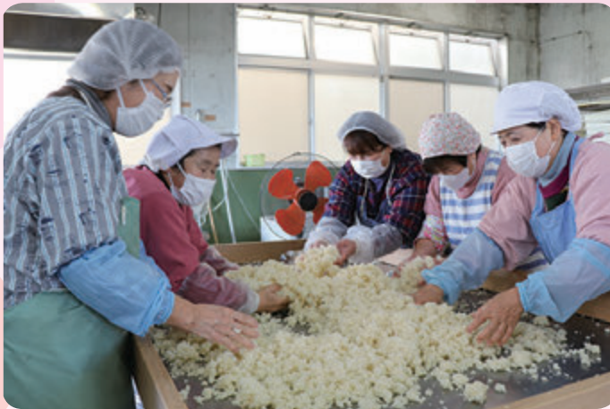
ふかした米にこうじ菌を混ぜ合わせる女性会員ら

JAしもつけ各地区女性会で冬の風物詩である「みそ作り」が1月中旬に最盛期を迎えました。12月6日の藤岡地区を皮切りに、各地区で続々と仕込みを開始。今年は、全地区合計で約6500kgのみそを仕込みました。