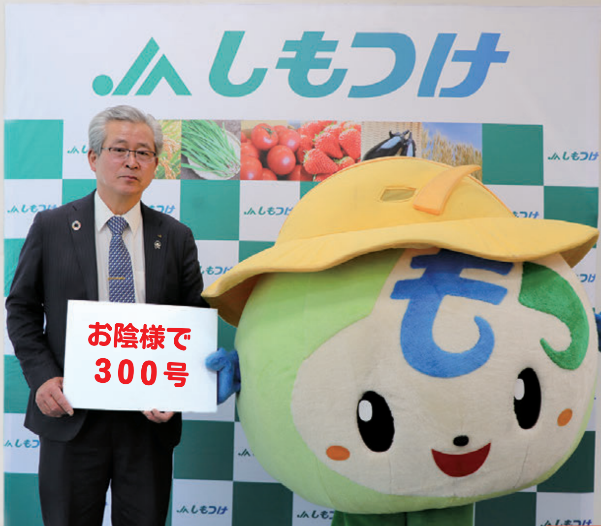
広報誌「しもつけ」300号の発行を喜ぶ長組合長と「シモンちゃん」