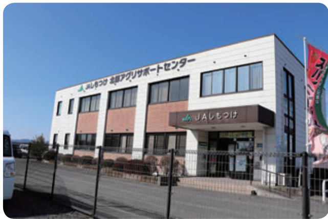
北部アグリサポートセンター

3月1日からの営農経済センター再編・集約に加え、本店に産直課・典礼課を新設。新センターの営農部門を営農振興課・農産課・園芸課、経済部門を経済事務課・経済営業課に分けました。また、営農部門は事業承継支援事業、農地相談窓口の設置等、経済部門は園芸相談会や購買配送業務等のサービスを始動しました。