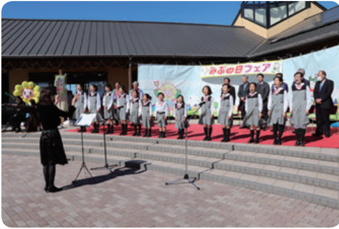
ステージで合唱を披露する壬生町少年少女合唱団のみなさん

2人の子どものともに来場した女性は「普段から、子どもたちの食育の観点からも地元産農産物を積極的に消費するように心掛けています。今後もJAの直売所やイベントの出店などを通じて地元産農産物を買いたい」と話しました。