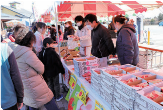
農産物を買求める客でにぎわうJAしもつけのブース