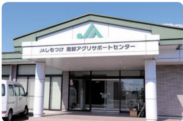
南部アグリサポートセンター